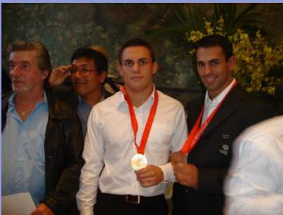
FRERES GUÉNOT LORS DES J.O. DE PÉKIN EN 2008.

Le monde de la lutte, sport amateur par excellence et de ce fait peu médiatisé, est en colère.