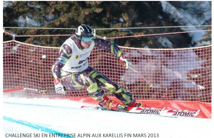
CHALLENGE SKI EN ENTREPRISE ALPIN AUX KARELLIS FIN MARS 2013

Ces titres rendus obsolètes par les nombreuses assurances individuelles étaient très souvent mal perçus par les stations de ski. Il faut ajouter à cette analyse que certaines stations de ski se veulent avant tout familiales et refusent parfois d'organiser des compétitions, d'autant que ces dernières années, la neige s'est faite rare dans certaines de nos stations de ski. Bravo à tous ces athlètes.