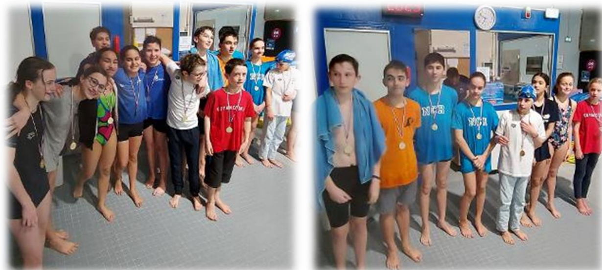
Podiums des deux relais ex-aequo ayant parcouru 2905m en pap, brasse et crawl

Les entraîneurs phosphorent pour constituer les relais 15 minutes